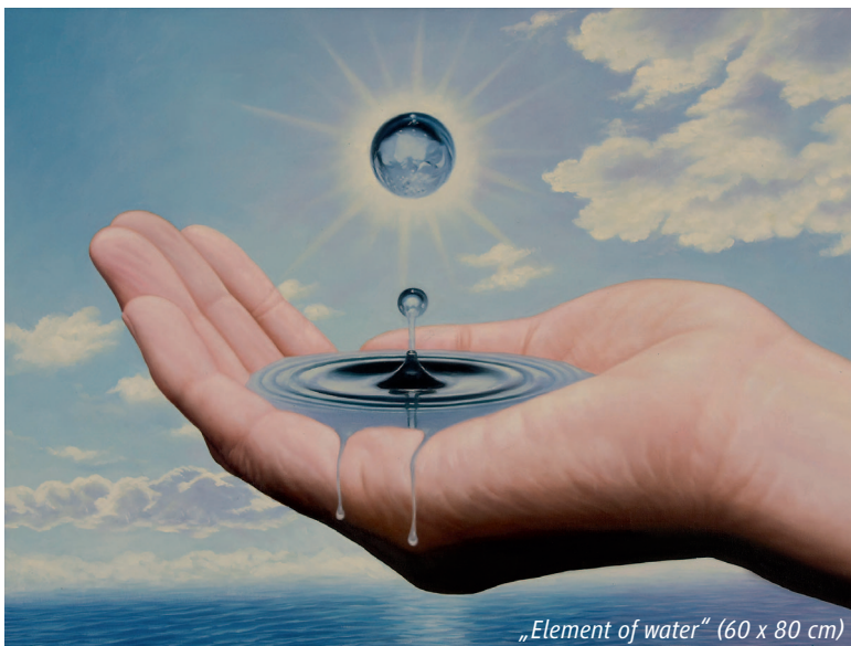
„Element of water“ (60 x 80 cm)

Hotel Chlosterhof Öhninger Straße 2 · CH-Stein am Rhein Telefon 004176 330 66 23 · www.art-schoch.ch